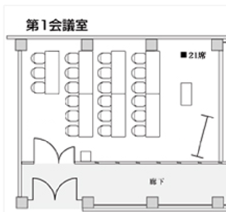
レイアウトイメージ(スクール形式)