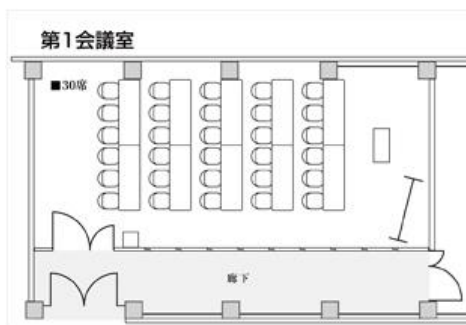
レイアウトイメージ(スクール形式)